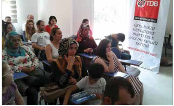
Diş çürüğü ve dişeti hastalıklarından çok etkilenen özel bakım gerektiren bireylerde ağız diş sağlığını geliştirmek için öncelikle ailelere yönelik eğitimler veriliyor.

Sağlık Bakanlığı Halk Sağlığı Kurumu tarafından okul çocuklarında yürütülen flor vernik uygulaması çalışmalarını takip etmek yönünde çalışmalarımız sürüyor. Pek çok dişhekimini, çocukları ve ailelerini yakından ilgilendiren bu uygulamada TDB olarak daha aktif rol alabilmeye yönelik çaba-