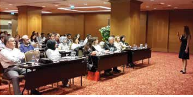
TDB Akademi etkinlikleri geçtiğimiz yıldan itibaren dişhekimleri odalarının işbirliğiyle Oda bölgelerine de yayılmaya başladı.