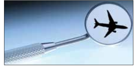
Sağlık turizmiyle ilgili Yönetmelik dışhekiminin mezuniyetiyle elde ettiği yetkileri kısıtlıyor.