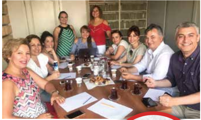
Kongre Sosyal Komitesi bir toplantı sırasında.

Sosyal program için bilimsel programdan arta kalan