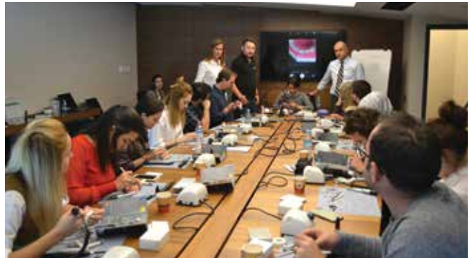
TDB Akademi etkinlikleri kapsamındaki uygulamalı kursların TDB Akademi salonunda verilebilmesi amacıyla gerekli altyapı hazırlanıyor.

Evet. TDB, Eğitim Komisyonu aracılığıyla çeşitli konularda yayımladığı kitaplarla da dişhekimliği alanındaki boşlukları doldurarak, mesleğin geliş-