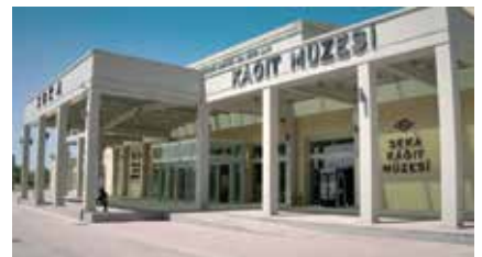
Cumhuriyet'in ilk döneminin en önemli yatırımlarından Seka'dan geriye bu kağıt müzesi kaldı.