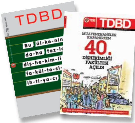
TDB, dişhekimliği fakültelerinin ve kontenjanlarının artırılmasına ilişkin uyarılarını hep sürdürdü.

nun sebep ve müsebbiplerine ilişkin kendi yorumunu yapabilecek bilgi ve görgüye sahip olduğundan eminiz. Ortaya çıkan tablonun dikkat çeken bazı yönlerini vurgulamakla yetineceğiz.