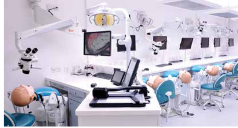
Dişhekimliği fakültesi açılması için bina ve teknik altyapıyı yeterli gören bakış açısıyla bu yıl 67 fakülte ve 6 bin kontenjana ulaşıldı.

Dişhekimliği fakültelerinin öğretim üyesi yetersizliği tartışılırken fakülte sayısının ve kontenjanların hızla artması nedeniyle farklı olanaklara sahip fakültelerde farklı eğitim model ve programları uygulanmaya başlanmıştır. Bu koşullarda yeterli