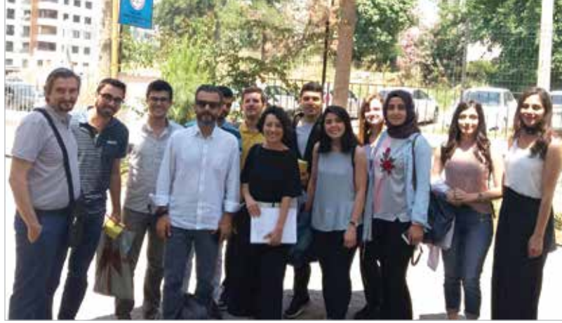
Ankara Altındağ Görme Engelliler İlkokulu'nda yapılan eğitim çalışmasından bir görüntü (solda). Toplum Ağız Dış Sağlığı Eğitimi projeleri Komisyon üyelerinin ve genç meslektaşlarımızın özverili çalışmalarıyla yürüyor. Yukarıda çalışmanın Adana kısmını sürdüren ekip görülüyor.

Evet, eğitim materyallerinin görme engelli çocukların dokunma hissiyle öğrenmelerine olanak sağlayacak özellikte olması gerekiyor. Bu nedenle