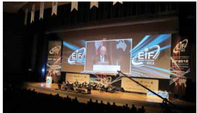
Daha önce sinevizyon vasıtasıyla perdeye yansıtılan görüntü bu yıl LED ekrana verilerek görüntü kalitesi yükseltilecek.

Hiç şüphesiz Ankara'nın en güzel ayı Eylül'dür. Uzun ve güzel bir yazdan sonra tatilin verdiği enerji ve mutluluğun devamıdır Eylül Ankara'da. İşte bu güzel ayda dolu dolu bir bilimsel programın ve keyifli bir sosyal programın beklediği Kongre'mizde 27-30 Eylül tarihlerinde Ankara'da birlikte olmak ve güzel bir kongre yaşatmak istiyoruz.